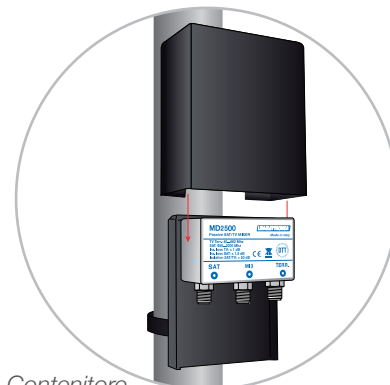
Contenitore da palo CPS2 ▲